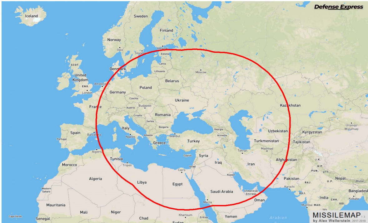
Նկար 2. Հիպոթետիկ արձակման վայրերից 2000 կմ հեռահարությամբ բալիստիկ հրթիռի խոցման գոտին

ընթացիկ նախագիծը, որը կդառնա Թուրքիայի առաջին միջին հեռահարության բալիստիկ հրթիռը, իրականացվում է ծայրահեղ գաղտնիության պայմաններում: Այն, ինչպես պնդում են, ունի ավելի քան 1000 կմ հեռահարություն, և բացառված չէ, որ դրա ստեղծման գործում Անկարային աջակցում է միջին հեռահարության բալիստիկ հրթիռների հարցում ավելի մեծ հաջողություններ գրանցած Իսլամաբադը 17 : CENK-ն առաջին անգամ ցուցադրվեց հանրությանը 2023 թ. մայիսին, և, ըստ հաղորդագրությունների, սպասվում էր, որ դրա փորձնական արձակումը տեղի կունենար մոտ ապագայում 18 : Նույնիսկ կանխատեսվում էր, որ այն փորձարկվելու է մինչև 2024 թ. ավարտը: Սակայն, նման փաստ ցայսօր պաշտոնապես արձանագրված չէ: Ավելին, որպես ընթացիկ մշակվող նախագիծ՝ CENK-ն անգամ ներառված չէ Թուրքիայի «2024–2028 թթ. Պաշտպանական արդյունաբերության ոլորտային ռազմավարության» փաստաթղթում 19 :