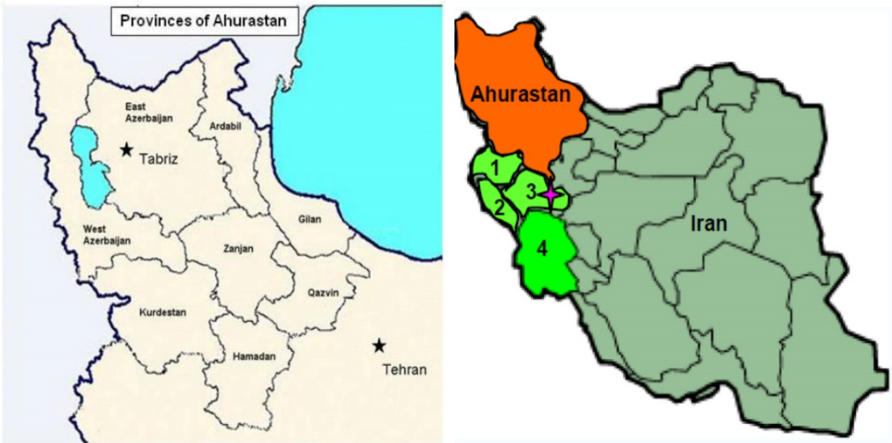
Նկար 2. Իրանից անջատված «Ախուրստան» ( ձախից ) և «Լուրիստան» ( աջից՝ բաց կանաչ: Այն ներառում է Իրանի Քերմանշահ (1), Իլամ (2), Լորեստան (3) և Խուզիստան (4) նահանգները) «հինքավար հանրապետությունները». GAAT, 2012–2013 թթ. ուսումնական տարի:

Կրկենք. սա GAAT վարժանքի 2012–2013 թթ. ուսումնական տարվա պատկերացումներն էին Հարավային Կովկասում 2018–19 թթ. զարգացումների մասին: Նորից զսպենք իրական 2018 թ. ներքաղաքական զարգացումների, կամ 2016 թ. Քառօրյա ու 2020 թ. 44-օրյա պատերազմների ընթացքի հետ դրա համեմատական վերլուծության գայթակղությունն ու արձանագրենք մեզ համար կարևոր հետևյալ հանգամանքները: