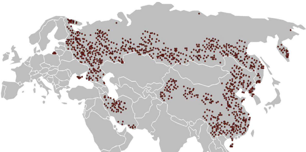
Նկար 4. Ռուսաստանին, Չինաստանին և Իրանին հասցված 1000 միավոր SUՁ ենթադրյալ համազարկի թիրախները:

Վերջապես, կարևոր է նաև այն, որ Իրանից անջատված «Ախուրստանի» գոյացմամբ ավելանում է Կասպից Ծովի ափամերձ ( լիտորալ ) երկրների թիվը՝ 5-ից (ՌԴ, Ղազախստան, Թուրքմենստան, Իրան, Ադրբեջան) դառնալով 6: Ինչը որակապես փոխում է Կասպից Ծովի «միջնագծային» «դելիմիտացիայի ու դեմարկացիայի» տրամաբանությունը 32 : Այսպիսով կանխվում են Իրանի հավակնությունները Հարավային Կասպիցի «Ալվ-Շարգ» և այլ նավթագազային դաշտերի հանդեպ, քանի որ դրանք այժմ կգտնվեն Կասպիցի ափեզրի «Ախուրստանի» հատվածում՝ ադրբեջանա-թուրքական վերահսկողության տակ (2012–13 թթ.-ին առիթ էինք ունեցել փաստել, որ Կասպիցի միջնագծային սահմանազատումը անհրաժեշտաբար կհանգեցնի ՀՀ և ԱդրՀ միջև «դելիմիտացիային ու դեմարկացիային» [21]):